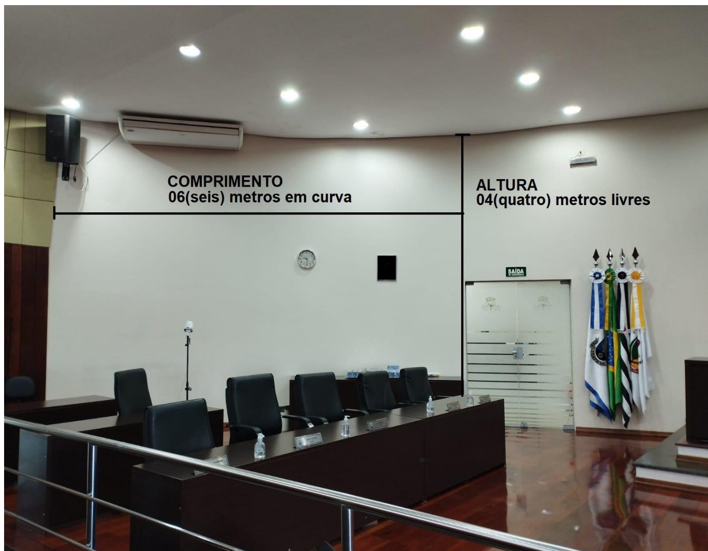
Plenário da Câmara Municipal de Itapeva - SP